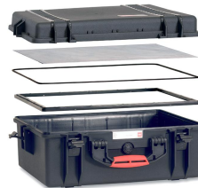
[ HPRCPF-002-01 ]

[ México D.F ] 55.8851.8726 - 55.8851.8725 [ Querétaro ] 442.234.1610 - 442.234.1338 www.harderback.com