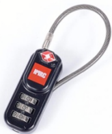
[ HPRCLO ]